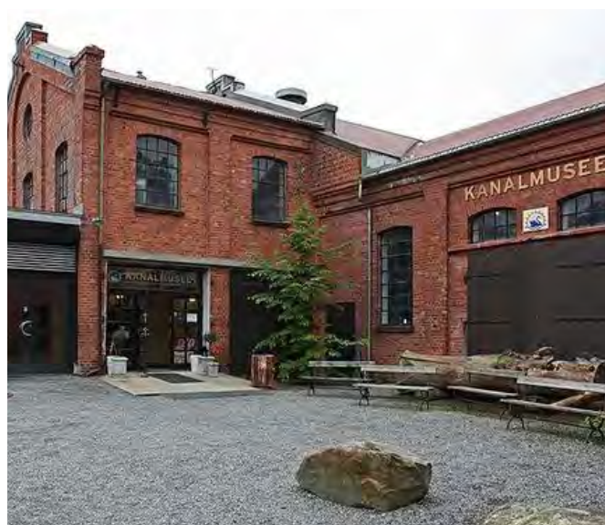
Et kontorfellesskap for pendlere og gründere kan gi grunnbunn for felles ideer og næringsetableringer. Kommunen vil jobbe for å etablere dette sentralt i Ørje.

Marker har et svært godt grunnlag å bygge videre på i så måte. Ørje sentrum har en kompakt struktur og de viktigste samfunnsfunksjonene er samlokalisert i bygdesenteret. Det er avgjørende at dette gode grunnlaget forvaltes videre på en god måte. Det