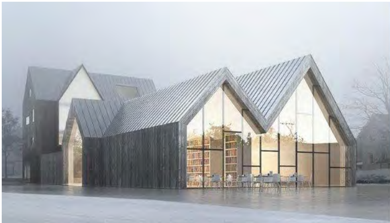
Eksempel på hvordan nytt bibliotek i Ørje sentrum kan være ledd i tettstedsutviklinga. Illustrasjon: Marker kommune, skisse